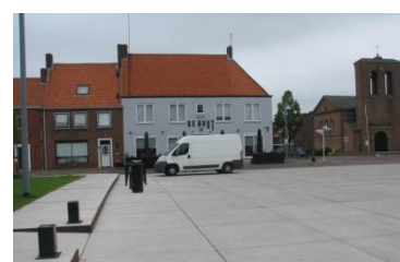
Géén parkeervakken !!