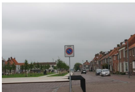
Begin van een parkeerzone

Willen we de busopstapplaatsen in ons dorp behouden, zal er voldoende ruimte over moeten blijven voor het keren van de bus.